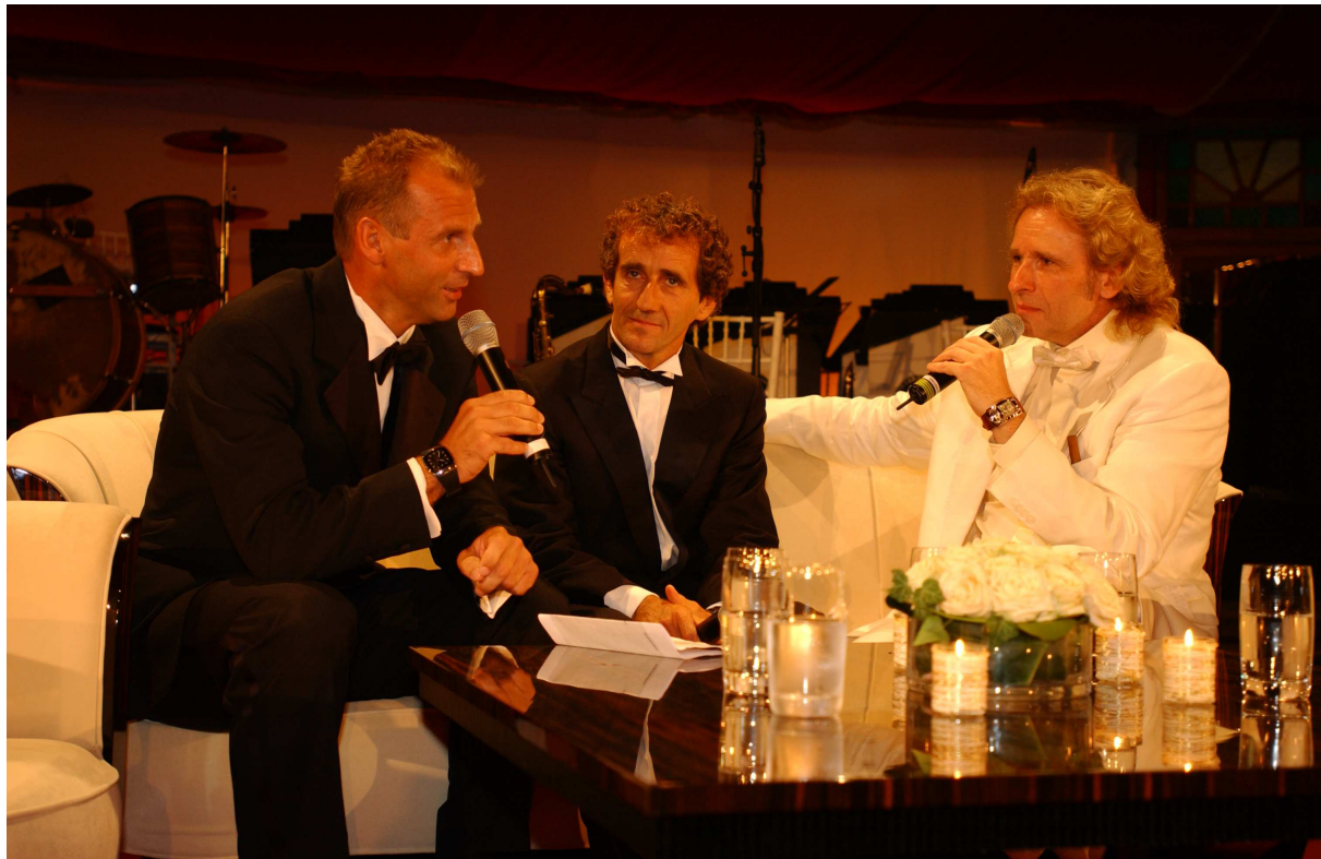
Bugatti Automobiles S.A.S – Präsentation & Werkseinführung des Veyron 16/4-1001 Ps