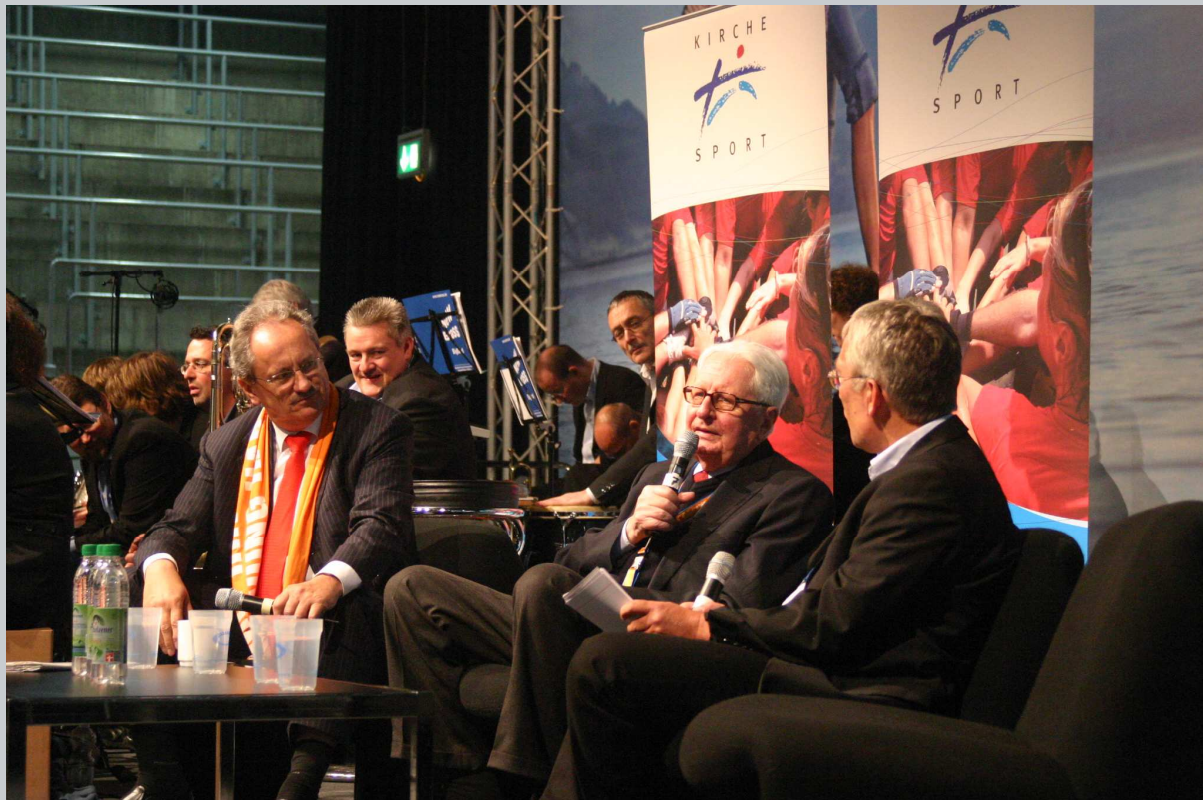
Veranstaltungstechnik komplett für Olympia-Eisstadion und Trainingshalle 2.Ökumenischer Kirchentag München