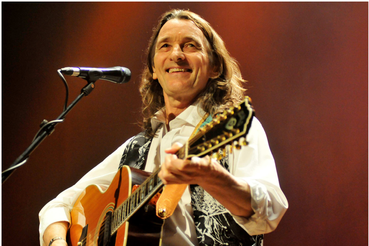
Roger Hodgson formerly Supertramp Stadthalle Biberach 2009

Reamon J.B.O. Schandmaul Bellybutton & the Knockwells Die Happy Mark Foggo's Skasters Saxon Revolverheld Rose Royce The Busters Karpatenhund Lou Bega Subway to Sally The Inchtabokatables Boppin`B Fehlfarben Oomph Flying Pickets Daniel Schuhmacher Cassandra Stehen Axxis Axxis Donots Cassandra Steen