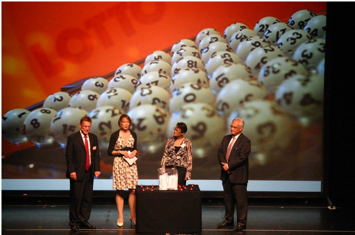
Großbildprojektion für 175 Jahre Jubiläum Hohenzollersche Landesbank